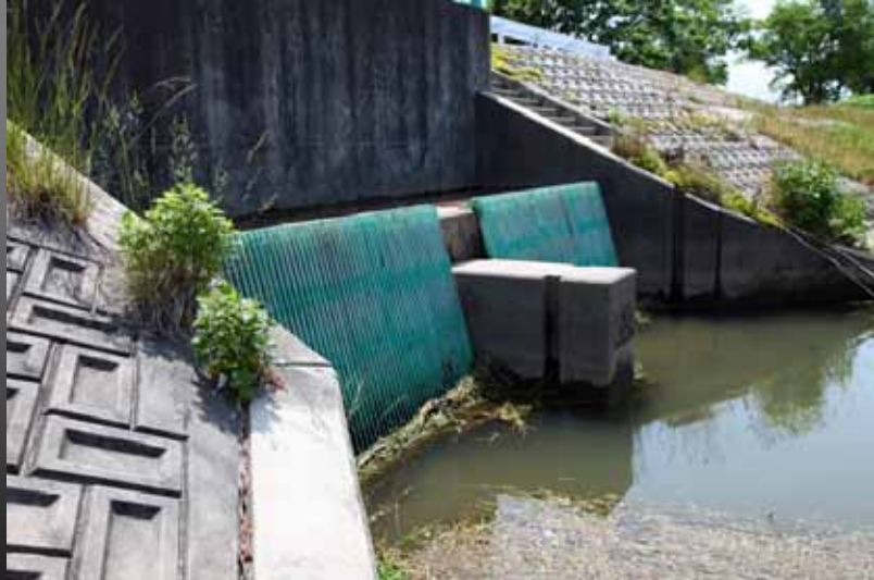
定期的な清掃が必要